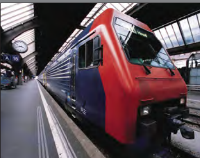
Tidligere bragt på www.dr.dk/P4 11. maj 2011

Umiddelbart ser det ud til, at den positive udvikling fortsætter, for i dette års første tre måneder har togpersonalet kun anmeldt 29 tilfælde af vold og trusler.